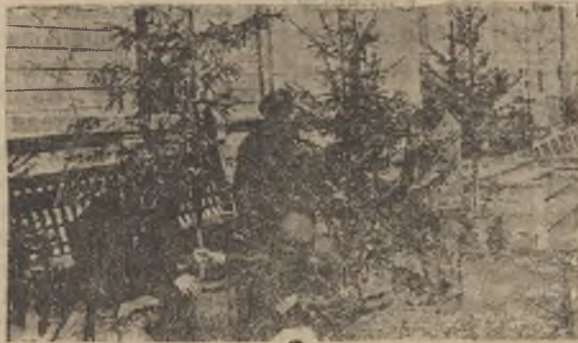
На субботнике 25 апреля посадка елочек.

примером вызывает он здоровый задор у котельщиков. Тарахтят шестерни подъемного крана. Стальная рука крана уверенно берет тяжелые грузы металла и все ложит на вагонетки, которые одна за другой выка-