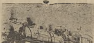
Паровоз в подарок Первомаю.

вывело окончательный итог и признало первое место за вагонным цехом, давшим наилучшие показатели по основным измерителям по производительности труда и